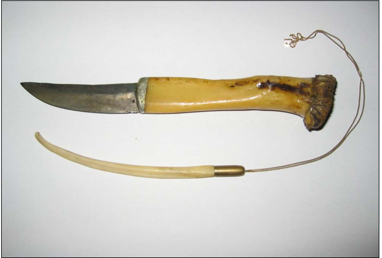
Kuvassa karhunluupuukko ja siitinluu kaulakoru